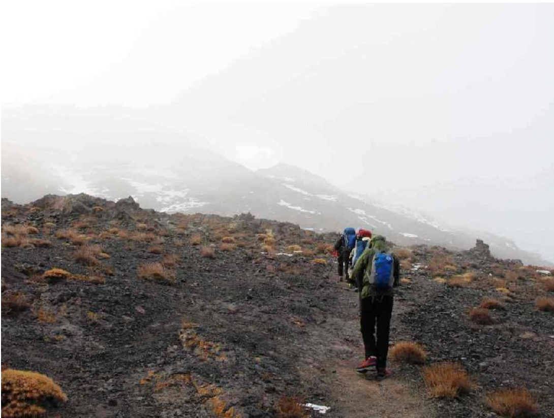
ساعت ۰۷:۳۷ - بر روی یال مه آلود شمالی - ۳۷۰۰ متر