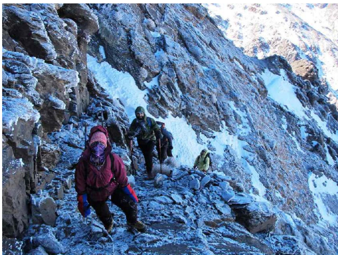
ساعت ۱۰:۰۶ - دست به سنگ کم کم شروع می شود