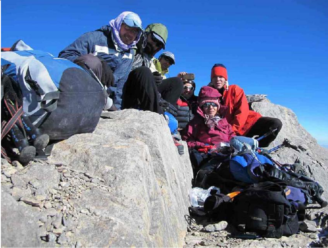
اعضای گروه شش نفره بر فراز چکاد هزار