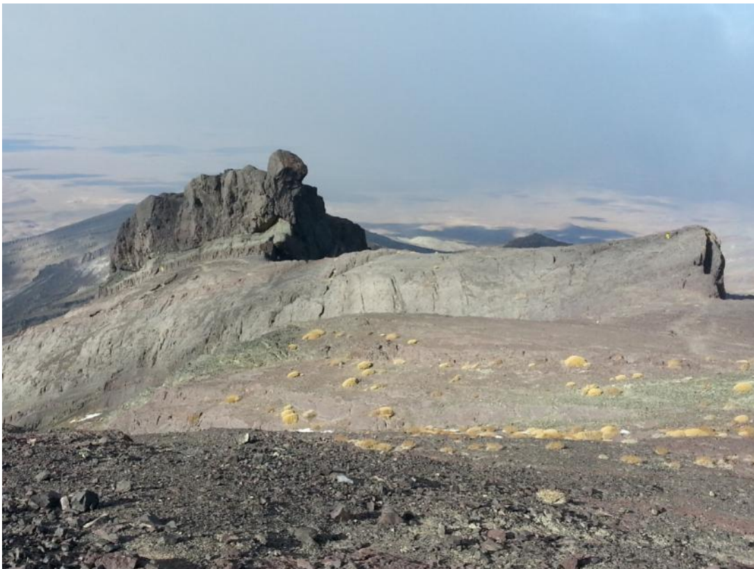
تاج خروس از مسیر فرود در ارتفاع ۳۸۷۹