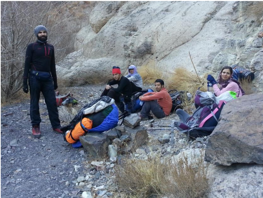
نرسیده به پناهگاه در مسیر صعود