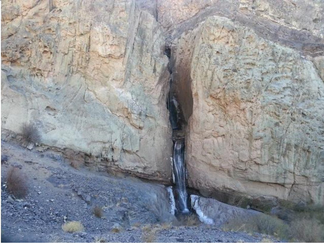
آبشار زر رود